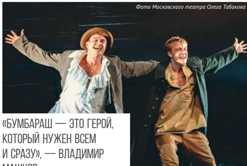
Фото Московского театра Олега Табакова

Фестиваль оперы и балета «Херсонес» – самое долгожданное культурное событие Севастополя. Это уникальная возможность для жителей и гостей города увидеть лучшие танцевальные и театральные постановки.